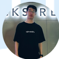
惠世冀 小源机器人项目组