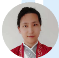
石垚 (水歌) 基础设施组 开源社官网 & 组织管理系统项目组